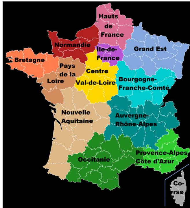
Les régions aujourd'hui (depuis 2015)