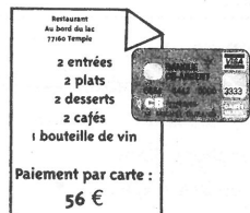
Payer 56 € par carte bancaire.