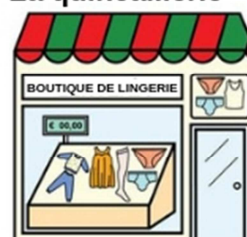
La boutique de lingerie