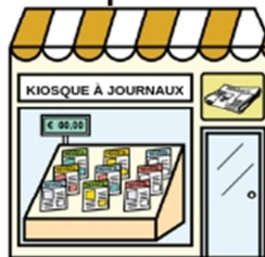
Le kiosque à journaux