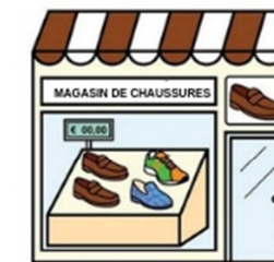
Le magasin de chaussures