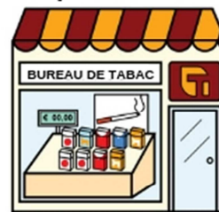
Le bureau de tabac