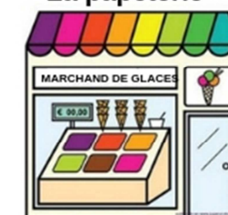
Le marchand de glaces