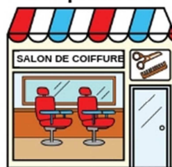
Le salon de coiffure