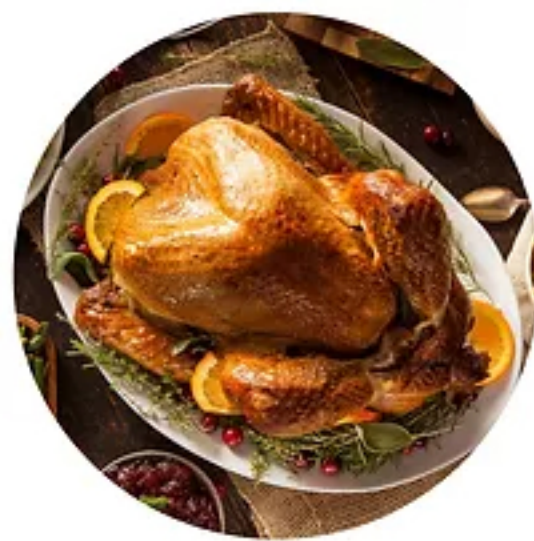
de la dinde