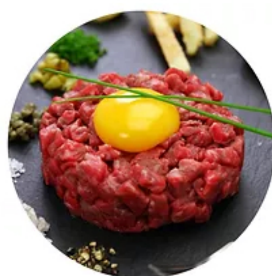
un steak tartare