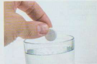
un comprimé / un cachet