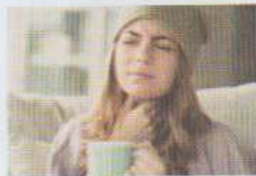
avoir mal à la gorge