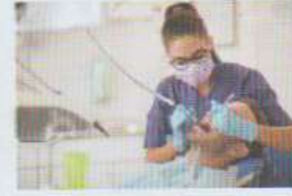
le / la dentiste