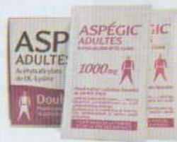
un sachet d'aspirine contre la fièvre