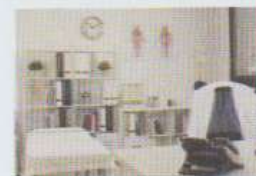
le cabinet médical