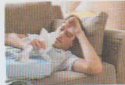
être malade / un(e) malade