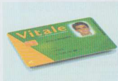
la carte Vitale