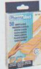
un pansement / un sparadrap