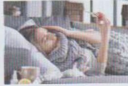
avoir la grippe