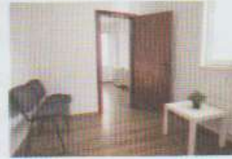
la salle d'attente