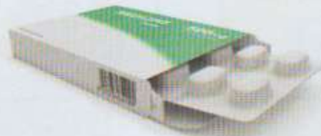
une boîte d'antibiotiques / de comprimés