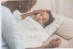
avoir de la fièvre