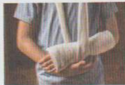
avoir un bras cassé