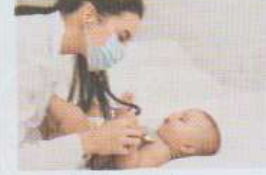
le / la pédiatre