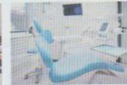
le cabinet dentaire