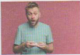
avoir un rhume / être enrhumé(e)