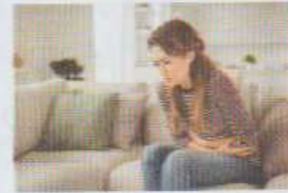
avoir mal au ventre