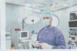
le / la chirurgien(ne)