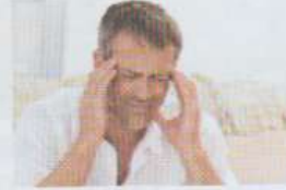
avoir mal à la tête