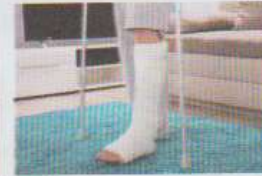
avoir une jambe cassée