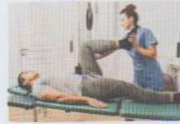
le / la kinésithérapeute (kiné)