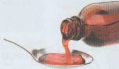
une bouteille de sirop