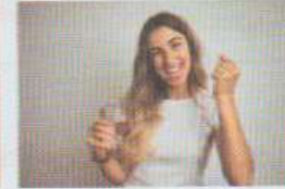
être en bonne santé