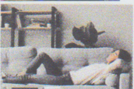
se reposer / se détendre