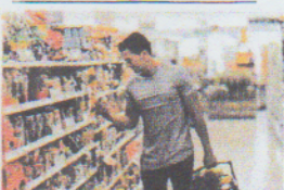
faire les courses