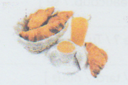
le petit déjeuner